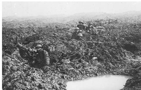
Canadese posities bij Passendale.

Na weken ploeteren vervoegen Nieuw-Zeelanders, Australiërs en Zuid-Afrikanen de uitgeputte Britse divisies. Na enkele successen stopt de aanval opnieuw. Het offensief stoppen, hoeveel levens dit ook kan redden, is geen optie. Een overwinning, ook al is het een symbolische, is broodnodig. Veldmaarschalk Haig's blik valt op Passendale. Het stukgeschoten dorpje bovenop de West-Vlaamse heuvelrug is sinds 1914 in Duitse handen en heeft mythische proporties aangenomen. Om die prijs te winnen, wendt Haig zich tot de Canadezen.